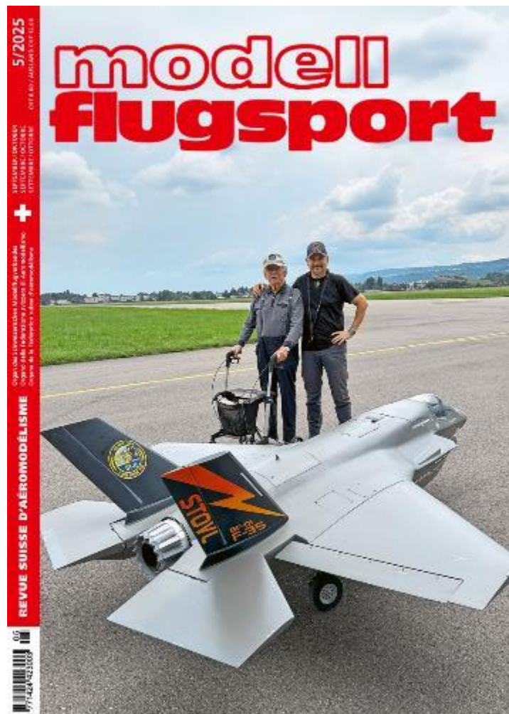
Delegiertenversammlung SMV vom 14.03.2026

Wenn ihr spannende Bauprojekte habt oder jemanden kennt, der an solchen dran ist, ermuntert ihn, zu schreiben oder mit einem Fach- oder Regionalredaktor Kontakt aufzunehmen.